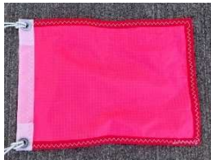
クラス旗 OPEN部門 (スタート5分前掲揚 スタート降下)