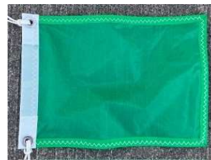
クラス旗 TRS部門(スタート5分前掲揚 スタート降下)