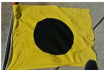
I 旗(スタート4分前掲揚 1分前降下)