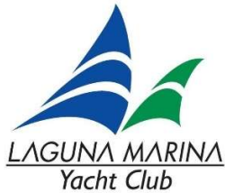
本部艇 ラグナマリーナヨットクラブ旗