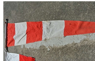
回答旗(AP 旗)延期の場合