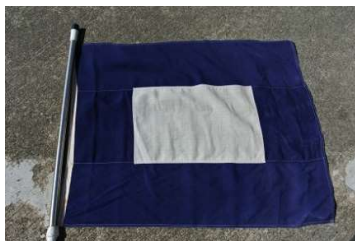
P旗 (スタート4分前掲揚 1分前降下)