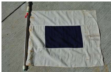
S旗(コース短縮のレース旗) クラス旗と一緒に掲揚