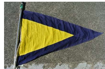
ゼネラルリコール旗(ホーン2声)