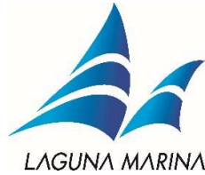
運営艇 ラグナマリーナ旗