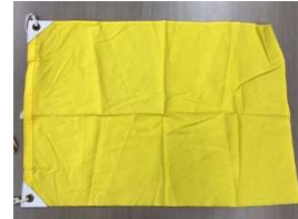
運営艇 黄色旗(吉田港沖海況観測灯浮標通過時に掲揚)